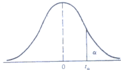
Table Critical Values of the t Distribution

試檢定其成績的分佈是否為一致性分配 (Uniform Distribution) ? \alpha = 0.05 (10%)