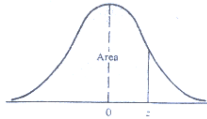
Table Areas Under the Normal Curve