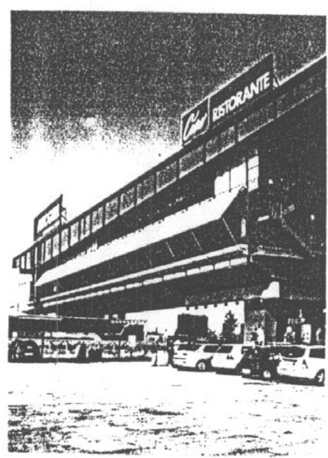
羅馬附近的公路休息站